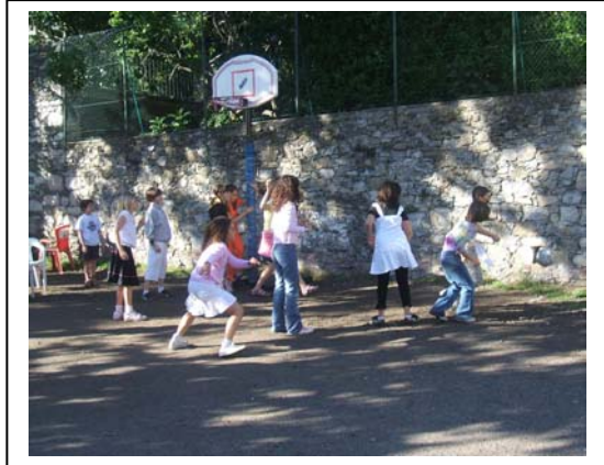
IL CORTILE DELLA CASA VACANZA