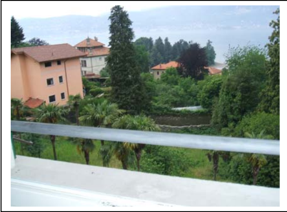
CAMERE CON VISTA LAGO